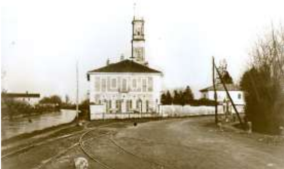
Zona di scarico dei vagoni del riso provenienti da Milano

A quei tempi il riso, il lardo e il pane giallo era l'alimento primo della povera gente. Con il riso, il lardo e il pane giallo bisognava elencare anche la polenta e le sardelle o saracc come le chiamavamo; mi ricordo che le sardelle arrivavano in casse circolari e mio nonno tutte le mattine le esponeva al pubblico fuori dal negozio vicino all'entrata.