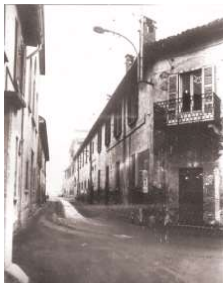
sede delle scuole elementari in via Besana nel 1917