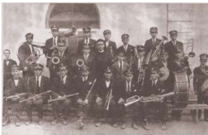
La banda parrocchiale nel 1925