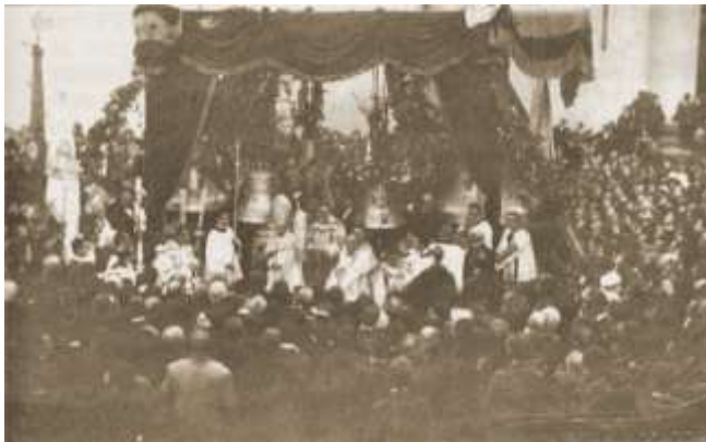
Il cardinale Ferrari benedice le nuove campane