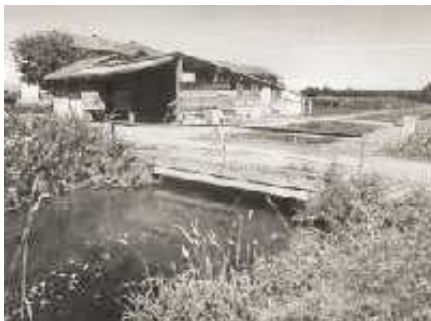
Cascina Sacca e ponte sul Villorisi

Ricordo le due stanze che si trovavano all'ultimo piano della cascina verso est con letti fatti coi cavalletti, i paioni e i cantarà .