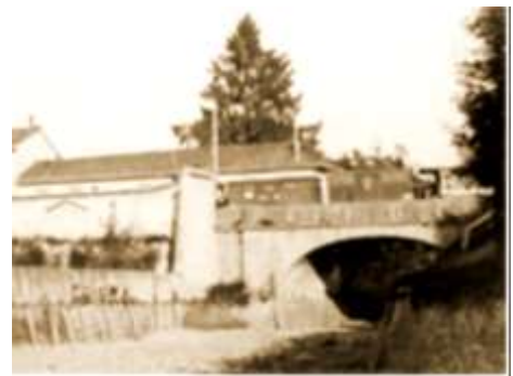
"Al Gamba de Legn" che transita sul ponte del naviglio Martesana in asciutta.

Io non so se mia sorella aveva capito forse era troppo giovane, ma io che ero là vicino al focolaio mi ricordo bene, tanto più che le persone che si trovavano lì tradivano l'angoscia del momento. Così anche per mio padre come per tutti gli altri arrivò il suo turno.