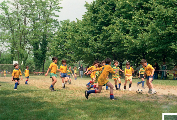
Torneo di calcio