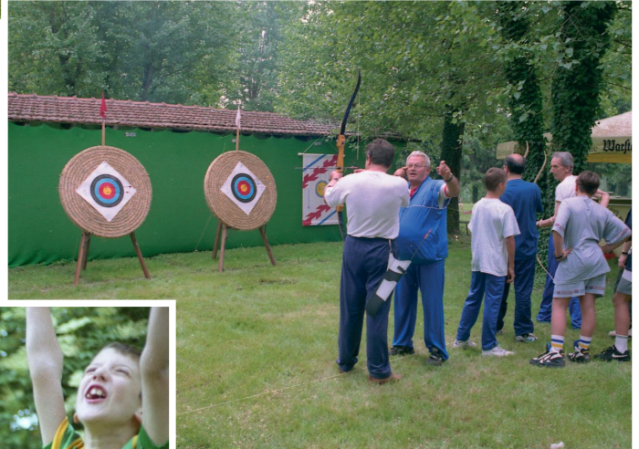
Tiro con l'arco