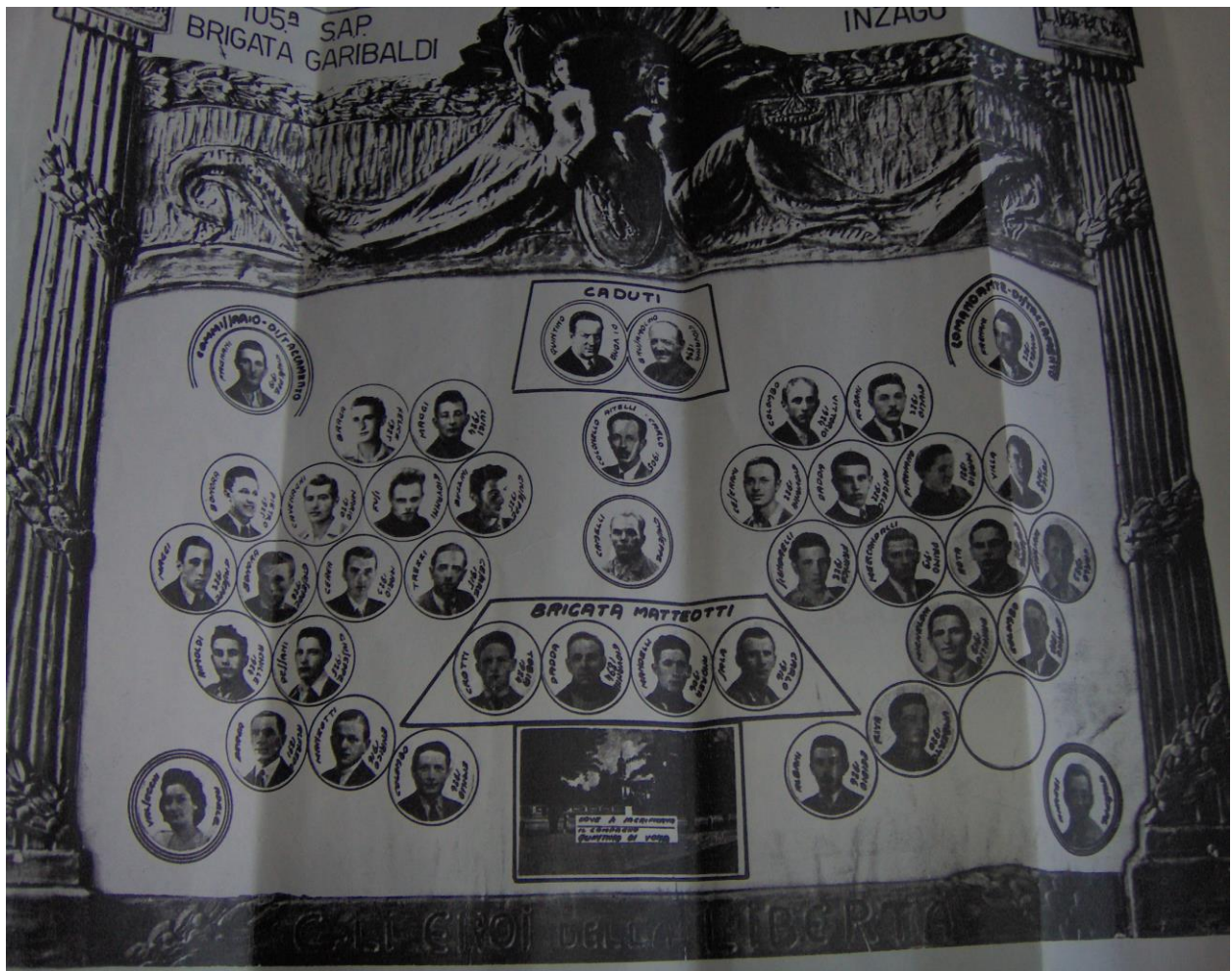
Partigiani inzaghesi e alcuni componenti il C.L.N.