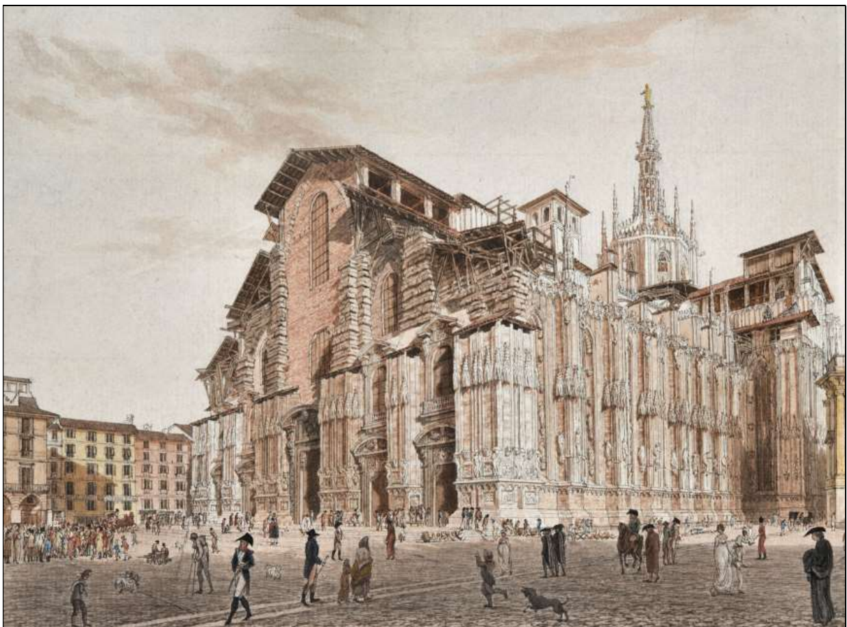
Il campaniletto in un paio di dipinti d'inizio (in alto) e di fine Settecento (in basso).