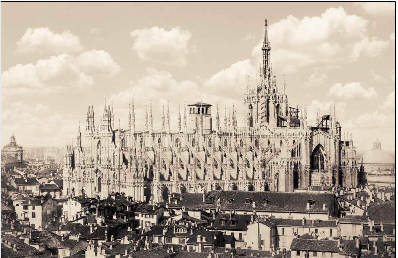
Il campaniletto in un paio di fotografie ottocentesche.