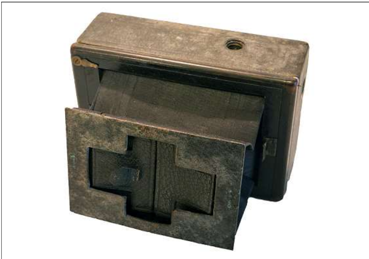
ERNEMANN a lastre formato 6½ x 9 cm (priva di obiettivo)